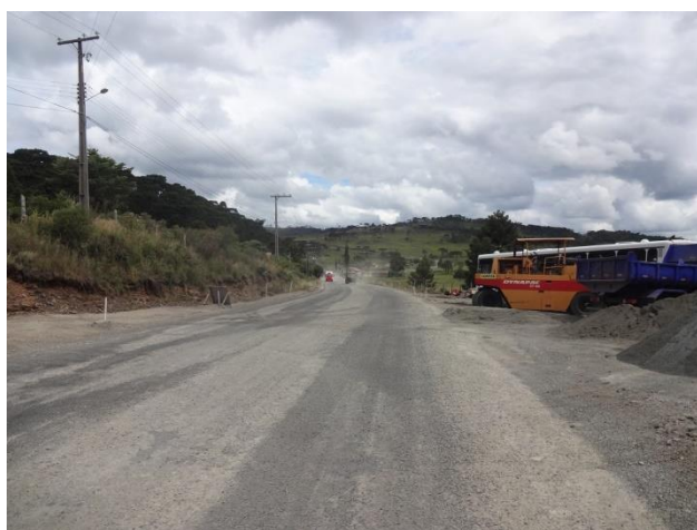
Serviços de recuperação contínuo do pavimento asfáltico ( \pm 12 km)