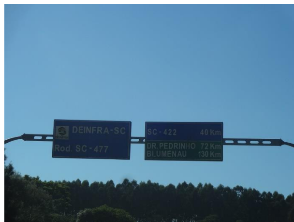
Segmento entre kms 3 e 21 (Alto Paraguaçu) em bom estado.