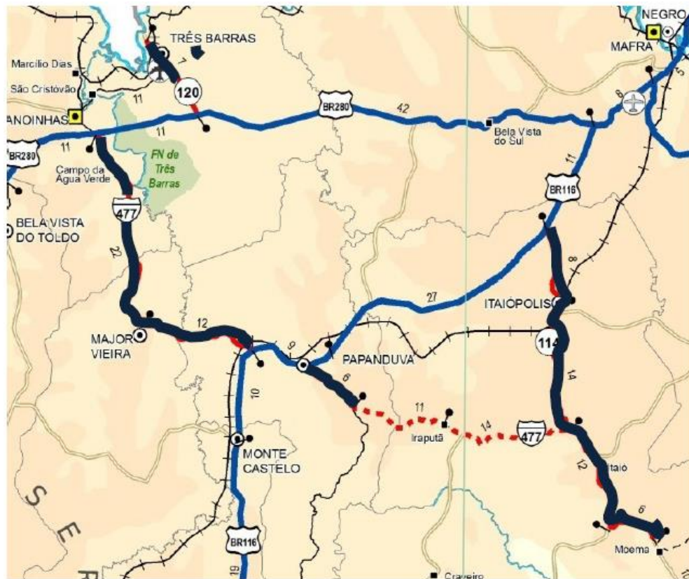
SC-120 (Acesso Três Barras); SCT-477 (Canoinhas/ Mj. Vieira/ BR-116); SC-114 (Itaiópolis/ Moema)