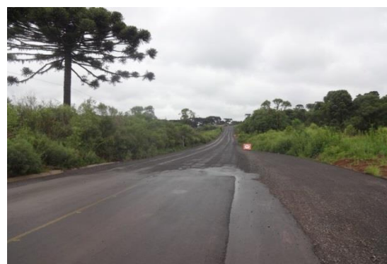
Trecho entre km 221 e 223 (Em obras)