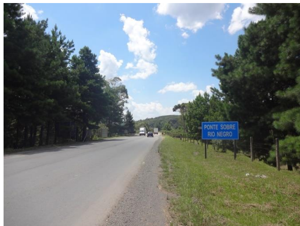
Segmento São Bento do Sul/ Fragosos (Divisa SC.PR) - 90% das obras revitalização executadas.