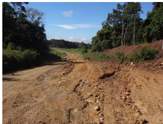
Trecho em obras entre Volta Triste e Moema.