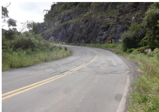
Defeito pontual na pista - km 361 (Bom Retiro/ Urubici)