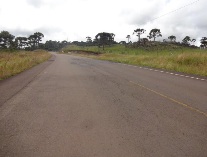
Situação do pavimento no km 23 (SC-370)