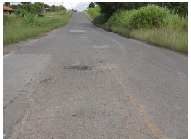
Km 24 - Situação do pavimento