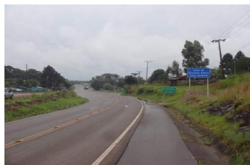
Segmento Campo Belo do Sul/ Cerro Negro e Anita Garibaldi, em bom estado de conservação e sinalização.