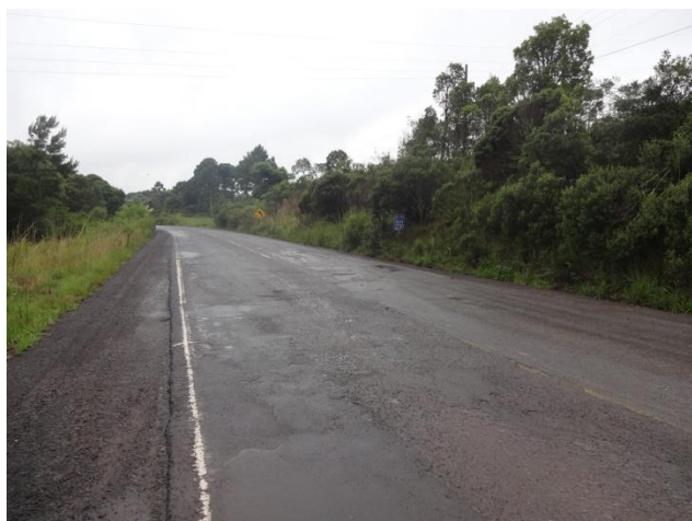
Situação do pavimento no km 230