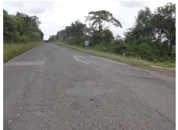
Km 32 - Situação deplorável do pavimento