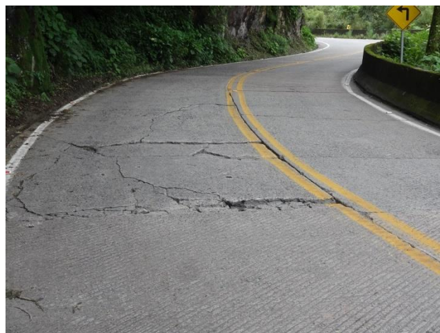
Pavimento no km 408,2 - Serra Rio do Rastro