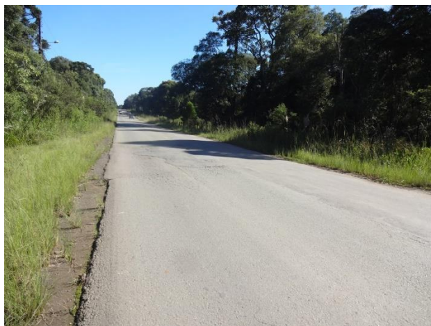
Trincas no pavimento no km 7,0