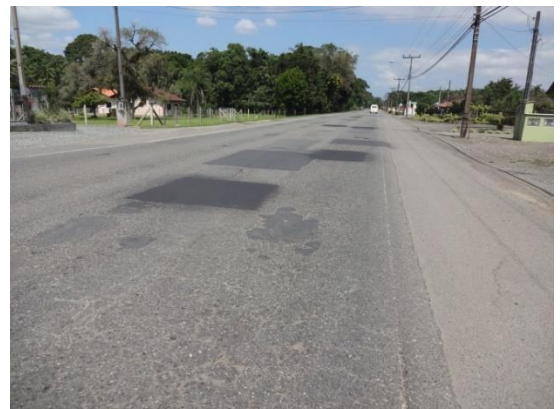
Operação "tapa- buraco" entre Campo Alegre/ Alto da Serra.