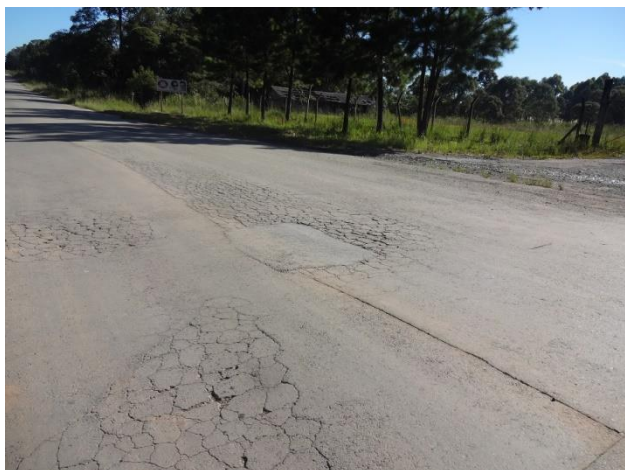
Km 5 - Danificação do pavimento