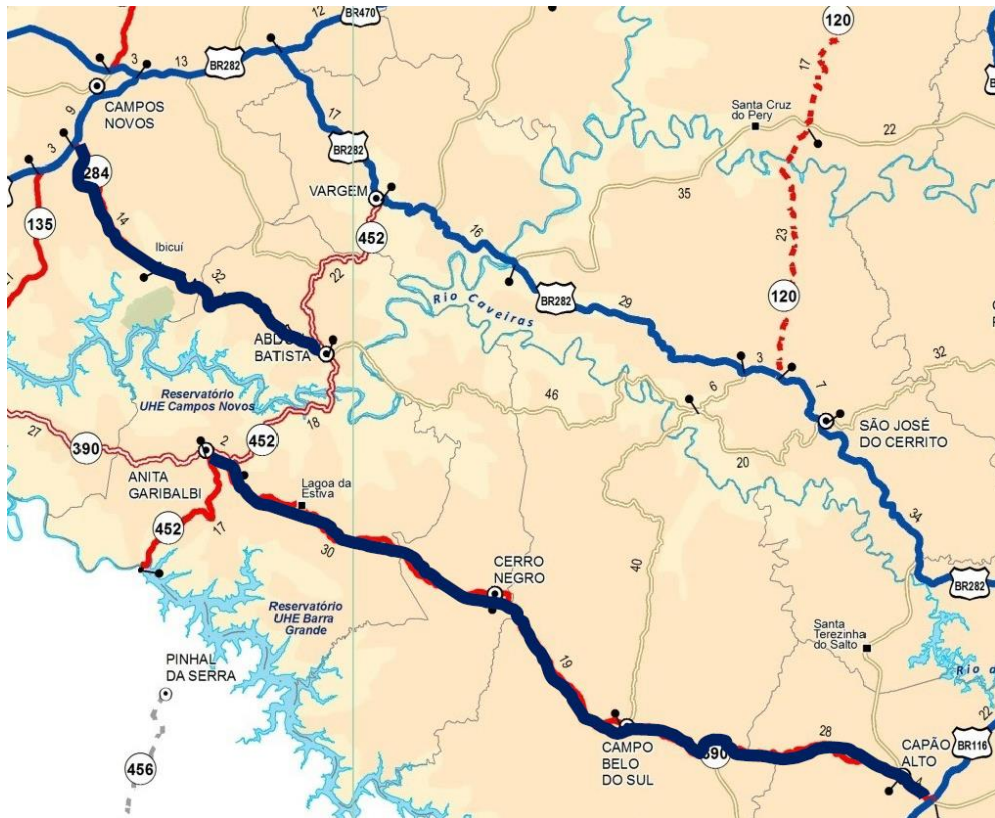
Rodovia SC- 390 (Capão Alto/ Campo Belo do Sul/ Cerro Negro/ Anita Garibaldi e SC- 284 (Abdon Batista/ Ibicuí/ Campos Novos).