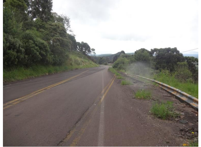
Deslizamento no km 9 (SC-370)