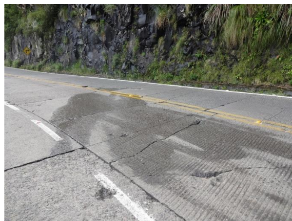
Situação do pavimento na Serra do Rio do Rastro (km 405,7)