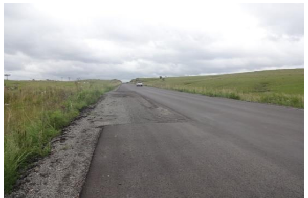
Lages - Painei: Situação da base que se repete em outros pontos.