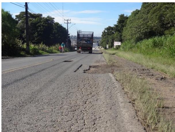
Acesso a Itaiópolis - km 6,5