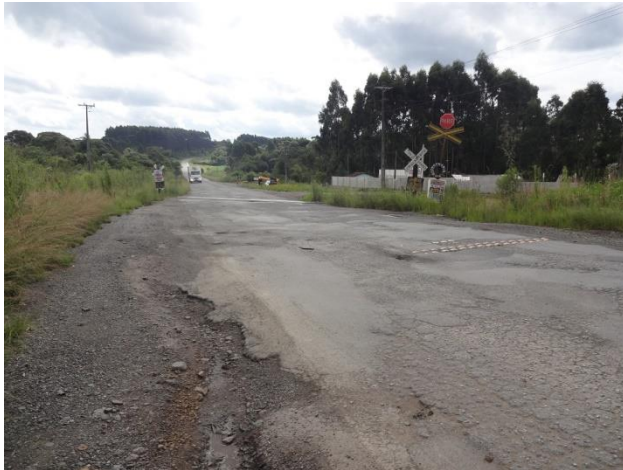
Situação do pavimento no entroncamento com a Rede Ferroviária