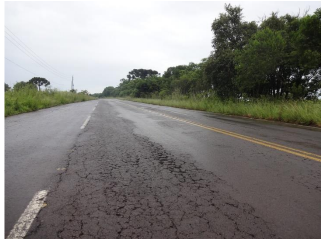
Km 272 - Situação que se repete em vários outros pontos (Ibicuí/ Campos Novos)