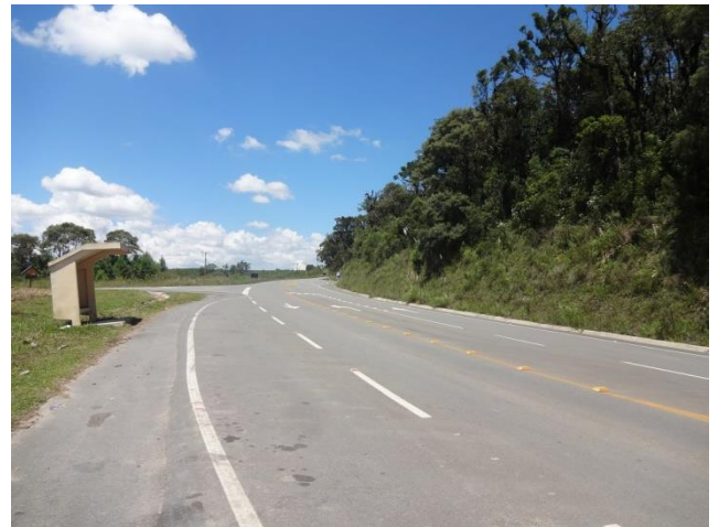
Km 19– Bom projeto e estado de conservação