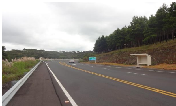
Sinalizações e obras complementares. Refúgio para ônibus.