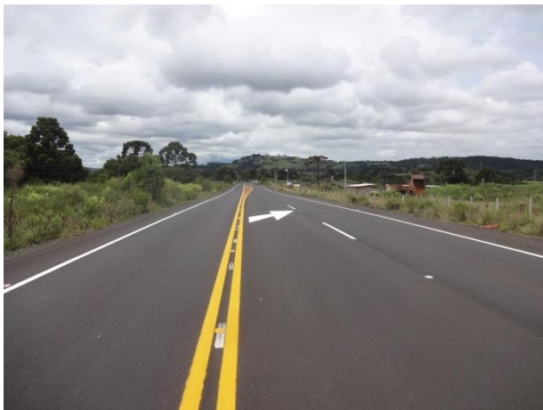
Excelente estado da Rodovia