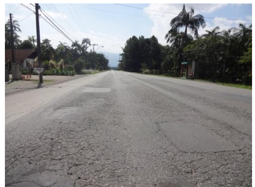
Km 4 - Situação do pavimento