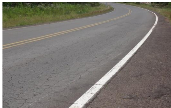
Trecho Urubici/ S. Joaquim - Estrada bem conservada. Problema pontual no km 383,3