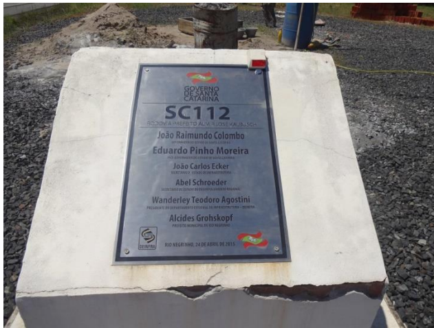
Estrada inaugurada em abril/ 2015 - Está em bom estado de conservação