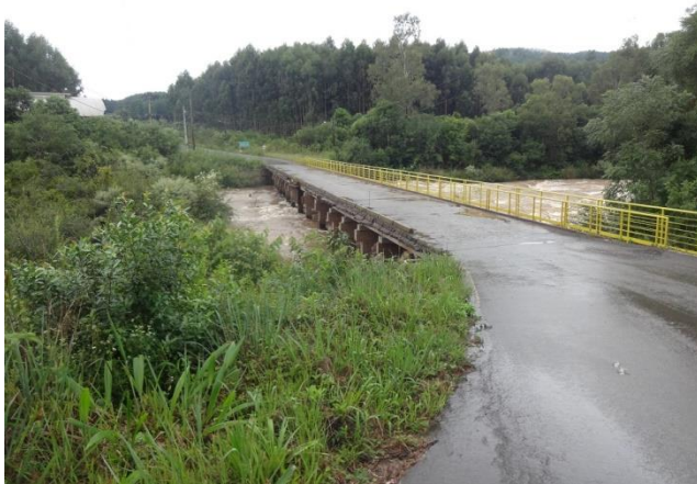
Ponte sobre afluente do Rio Caveiras em 1/2 pista