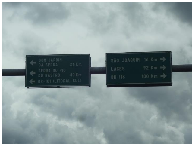
Entroncamento das SCs 110 e 390