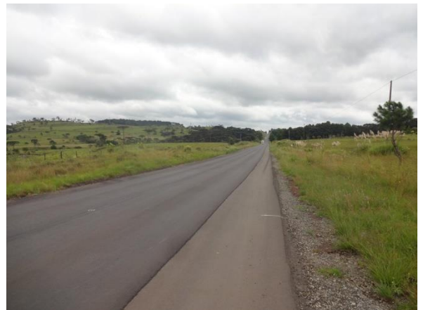
Recapeamento entre Lages e Painei